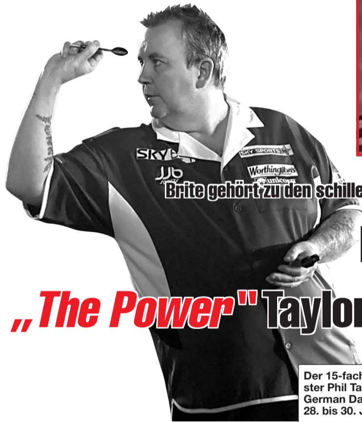
Brite gehört zu den schillerndsten Erscheinungen der letzten 18 Jahre