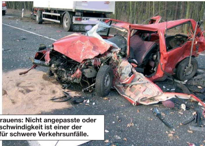
Ein Bild des Grauens: Nicht angepasste oder überhöhte Geschwindigkeit ist einer der Hauptgründe für schwere Verkehrsunfälle.