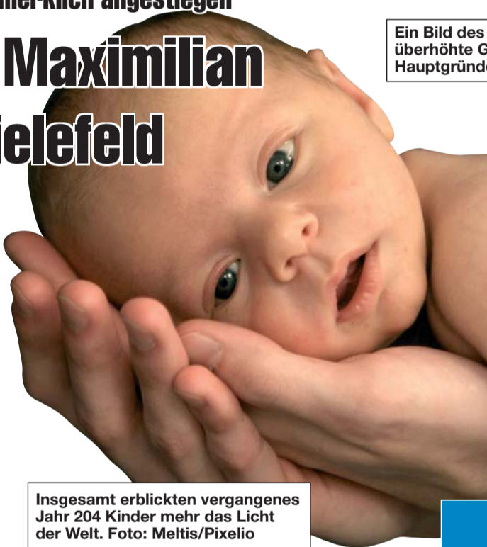
Insgesamt erblickten vergangenes Jahr 204 Kinder mehr das Licht der Welt.

Mitte. Die Zahlen der in Bielefeld geborenen Kinder sind im Jahr 2010 merklich angestiegen. Demnach kamen mit 4390 Neugeborenen insgesamt 204 Kinder mehr zur Welt als im Vorjahr. Favorit bei den Mädchennamen ist wie in 2009 mit einem leichten Rückgang noch immer „Marie“. Diesen ersten Platz muss sie sich allerdings mit „Sophie“ teilen. Beide Namen wurden insgesamt 77 Mal in die Geburtsurkunden eingetragen. Auch bei den Jungennamen ist der Vorjahresfavorit „Maximilian“ mit vier zusätzlichen Nennungen gleich geblieben; 51 Neugeborene erhielten diesen Namen.