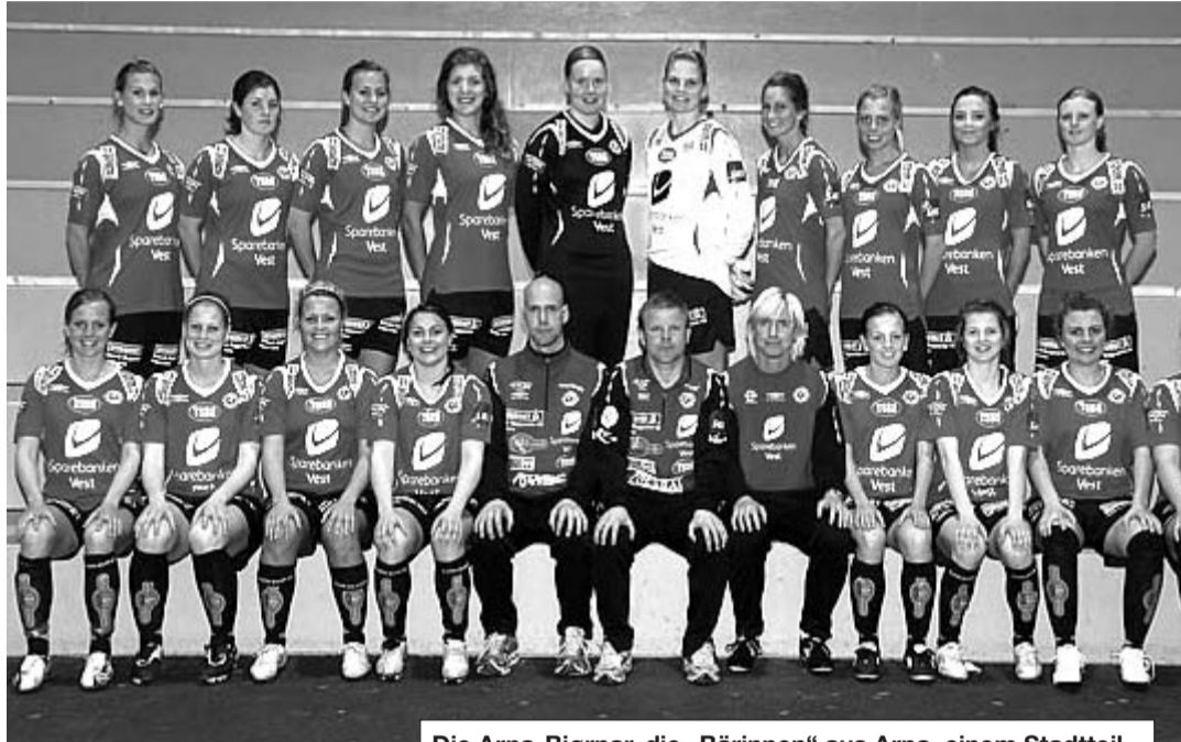
Die Arna-Bjørnar, die „Bärinnen“ aus Arna, einem Stadtteil von Bergen, sind zweifelsohne eine Mannschaft mit Zukunft. Nahezu alle Spielerinnen des Kaders dürfen noch in Juniorinnen-Nationalmannschaften auflaufen.

beiden bestplatzierten Vereine das Halbfinale. Fans und solche, die es werden wollen, haben noch die Möglichkeit, Tickets für „Weltklasse 2011“, dem Frauenfußball-Höhepunkt des Winters, bis zum 12. Januar online zu bestellen. Ferner gibt es bis zum 14. Januar Tickets exklusiv bei zwei Bielefelder Vorverkaufsstellen. Sie sind erhältlich bei „Strafraum - Der andere Sportladen in Ostwestfalen“, in der Bielefelder Innenstadt, Karl-Eilers-Straße 11 und in Jöllenbeck im „Reisebüro Joneleit“ an der Dorfstraße 16. Aber auch für Kurzentschlossene hält der Veranstalter an der Tageskasse noch ausreichend Tickets bereit. Doch auch für die, die es am 15. und 16. Januar nicht nach Jöllenbeck schaffen oder nur an einem der beiden Turniertage vor Ort sein können, gibt es das komplette Turnier als Live-Ticker im Internet auf der Homepage www.frauenturnier.com . TuS-Webmaster Axel Finger, der für diesen Service Verantwortung zeichnet, ist vom bisherigen Besuch der Homepage wieder begeistert: „Den internationalen Charakter unseres Turniers unterstreichen die zahlreichen Zugriffe. Aber nicht nur Deutschland oder halb Europa waren bisher Gäste. Selbst Besucher aus Australien, Ägypten, Brasilien und aus Nordamerika informierten sich in den letzten Wochen über das Jöllenbecker Hallenspektakel.“